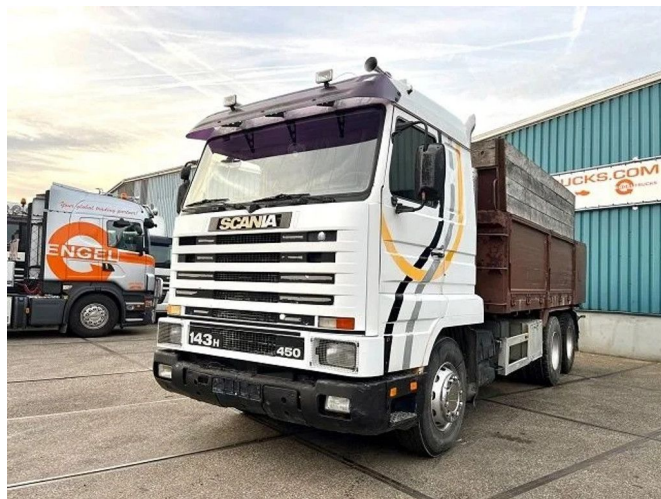
Scania R143-450 V8 STREAMLINE 6x2 FULL STEEL KIPPE...