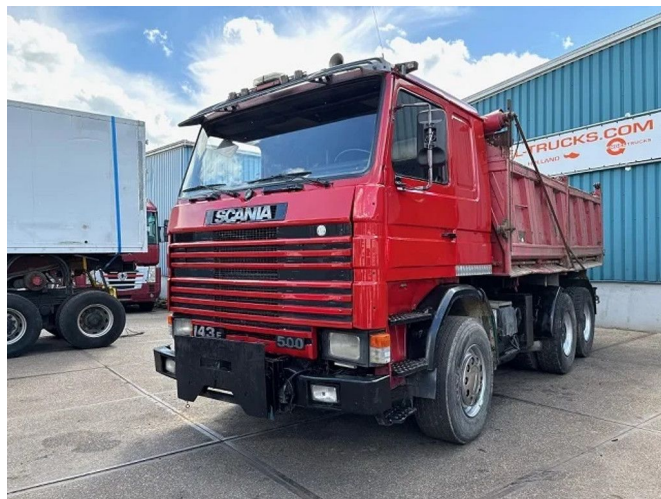
Scania R143-420 V8 6x4 FULL STEEL MEILLER KIPPER (M...