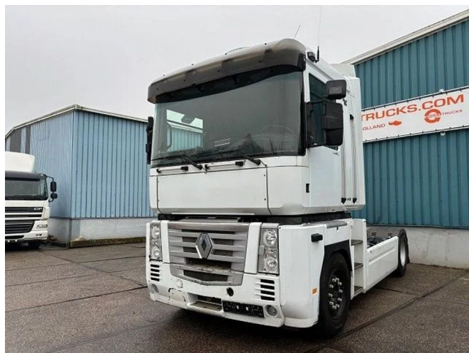
Renault Magnum 500 DXI PRIVILEGE (MANUAL GEA... 4x2