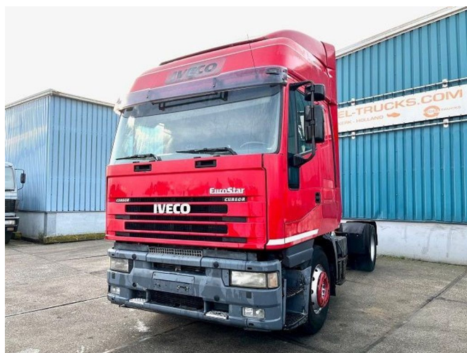
Iveco Eurostar 440.43 T/P HIGH ROOF (ZF16 MANUAL... 4x2 Referentienummer: SN 51319726 Z