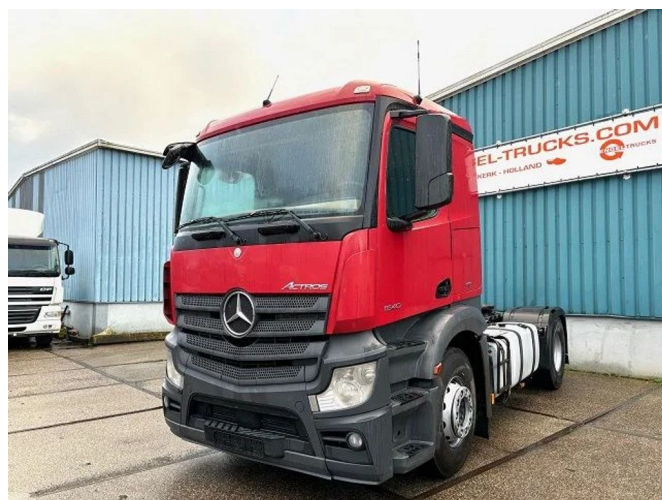
Mercedes-Benz Actros 1840 LS 4x2 SLEEPERCAB (6 IDENT... Referentienummer: SN 55962727