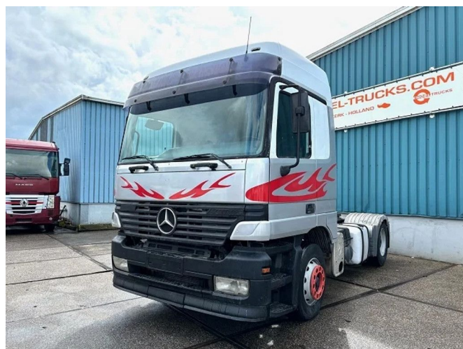
Mercedes-Benz Actros 1843 LS (MP1) (EPS WITH CLU... 4x2