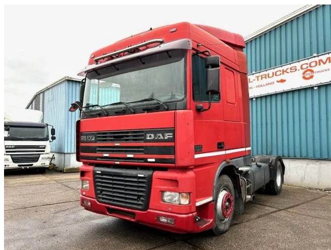
DAF 95.480 XF SPACECAB (EURO 3 / ZF16 MANUAL ... 4x2