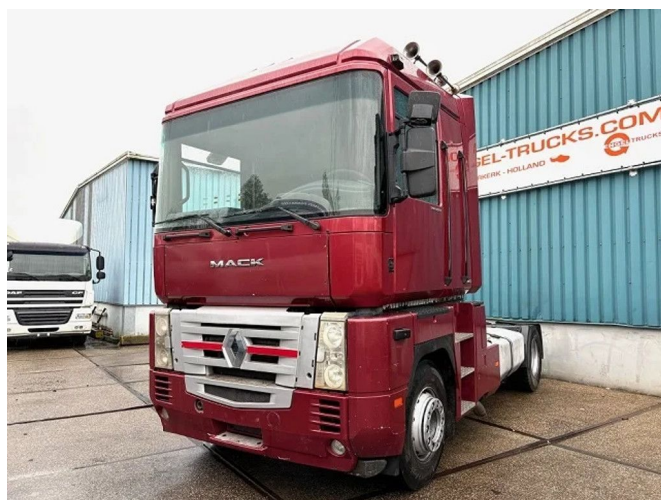
Renault Magnum 440 E-TECH (EURO 3 / ZF16 MANUA... 4x2