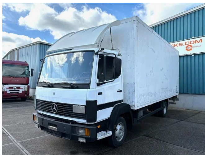
Mercedes-Benz LK 814 6-CILINDER WITH PLYWOOD ... 4x2