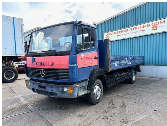
Mercedes-Benz LK 814 (6-CILINDER) FULL STEEL SU... 4x2