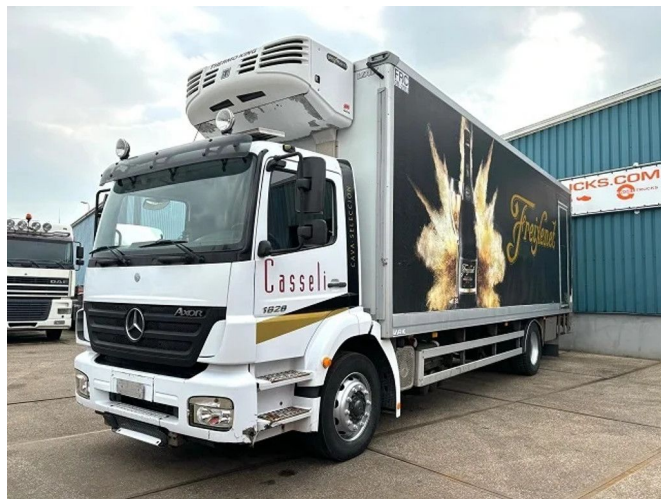
Mercedes-Benz Axor 1828 4x2 WITH THERMOKING SPECT...