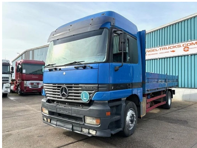
Mercedes-Benz Actros 1840 L (MP1) 4x2 STEEL-AIR SUSP... Referentienummer: SN 56363989 Z