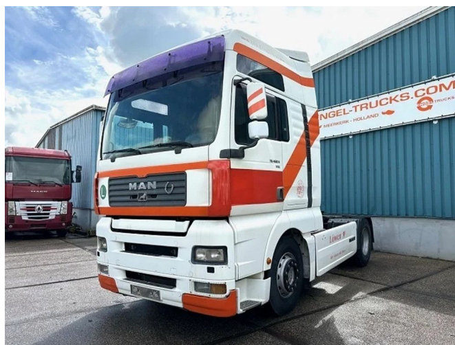
MAN TGA 18.460 FLS XXL (6 CILINDERHEADS!!) (ZF1... 4x2 Referentienummer: SN 56429608