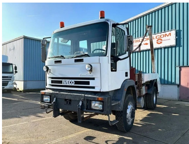
Iveco Eurocargo 135E23WR 4x4 FULL STEEL PORTAL CON...