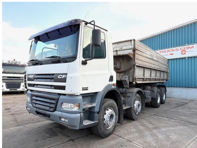
DAF CF 85.430 8x4 FULL STEEL 20m3 KIPPER (EURO 3 / ...