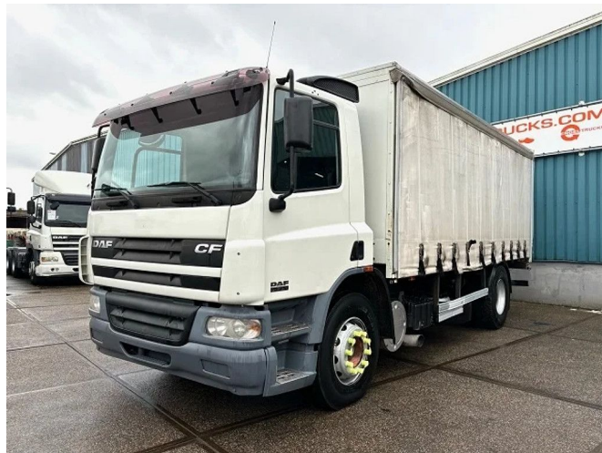
DAF 75 .310 4x2 WITH CURTAIN SIDE BOX (EURO 3 / MAN...