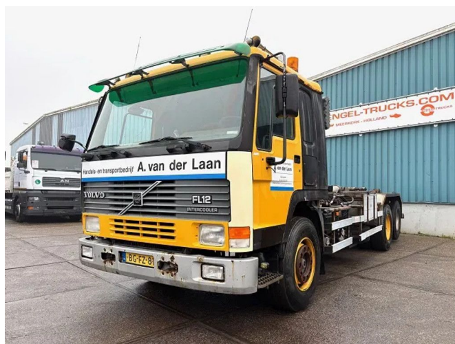
Volvo FL 12.380 6x2 A-RIDE (ORIGINAL DUTCH) HOOK-AR...