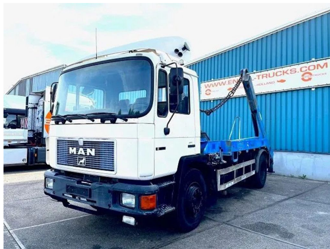
MAN 18 .232 (6 CILINDER) M90 WITH TELESCOPIC ... 4x2 Referentienuummer: SN 55609062