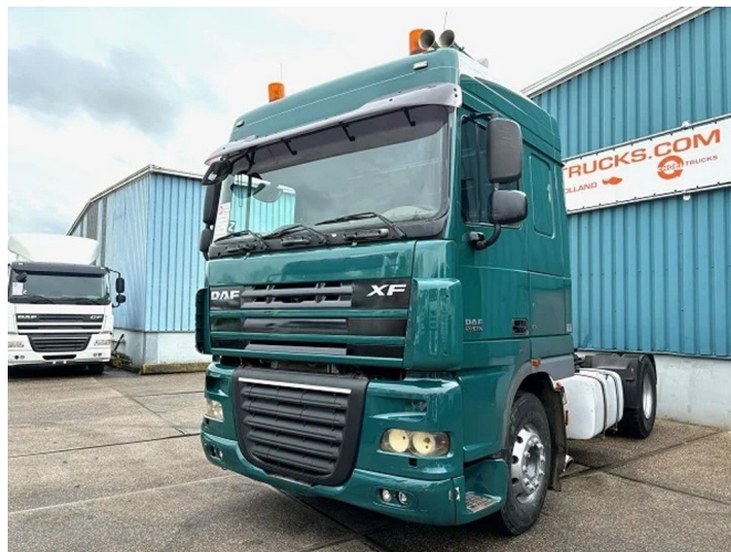
DAF XF 105.460 SPACECAB WITH KIPPER HYDRAUL... 4x2