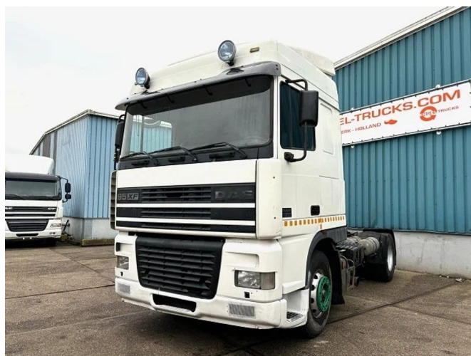
DAF 95.430 XF SPACECAB (EURO 2 / ZF16 MANUAL ... 4x2