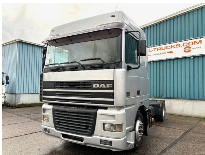
DAF 95.430 XF SPACECAB (EURO 2 / ZF16 MANUAL ... 4x2