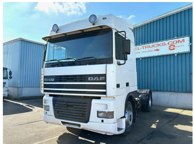
DAF 95.380 XF SPACECAB (EURO 2 / ZF16 MANUAL ... 4x2